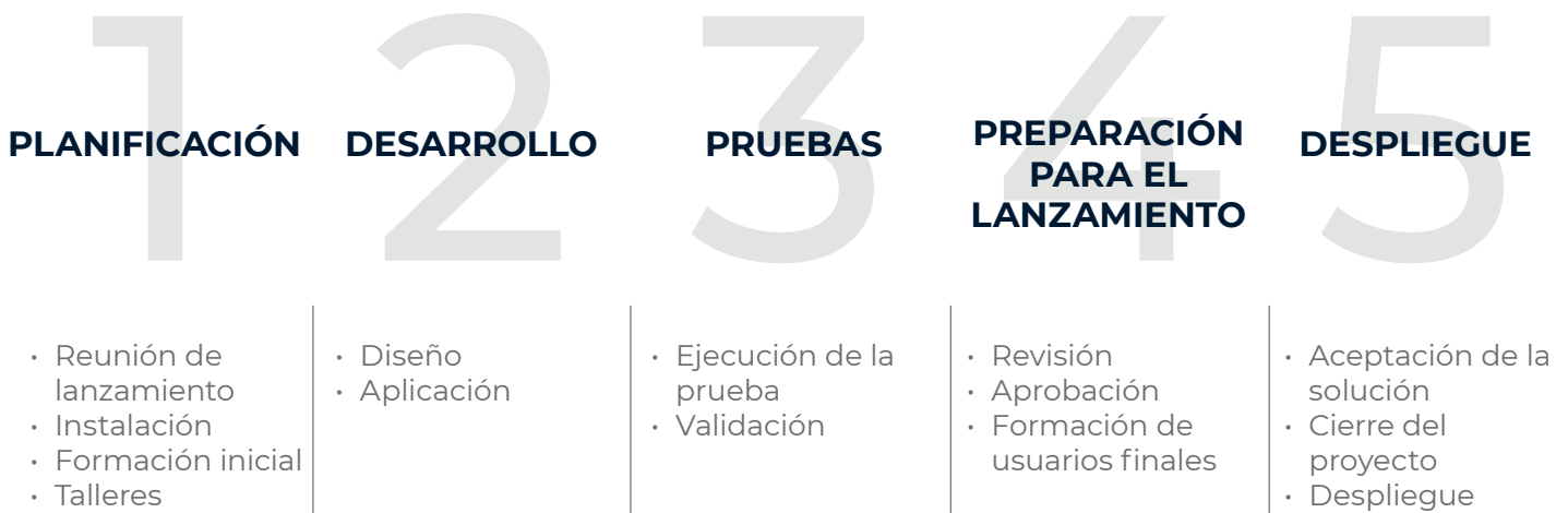
Fig. 7: Metodología de aplicación - Visión general

Nuestro éxito es su éxito. Estamos comprometidos a construir relaciones a largo plazo con cada cliente y nos enfocamos en brindar satisfacción al cliente y resultados de calidad. Nos apasiona lo que hacemos, y creemos en el trabajo de su laboratorio, en cualquier entorno en el que se encuentre.