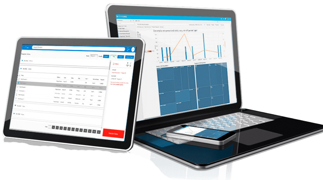
Fig. 6 - Movilidad

STARLIMS Mobile ofrece plantillas fáciles de usar y listas para usar para que pueda comenzar sin demora. Alternativamente, utilice el Diseñador HTML5 y Móvil y las características de codificación incorporadas de STARLIMS para crear aplicaciones personalizadas para su organización, tanto para dispositivos iOS como Android, desde la misma plataforma. Despliegue sus soluciones iOS y Android a través de la aplicación STARLIMS Mobile en las tiendas de aplicaciones de Apple o Google Play.