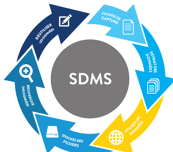
Fig. 5 - Resumen SDMS

Añada valor y reduzca la complejidad, los errores de gestión y los retrasos personalizando el sistema para que cumpla con sus normas y prácticas internas de aprobación, retención y archivo de datos y documentos.