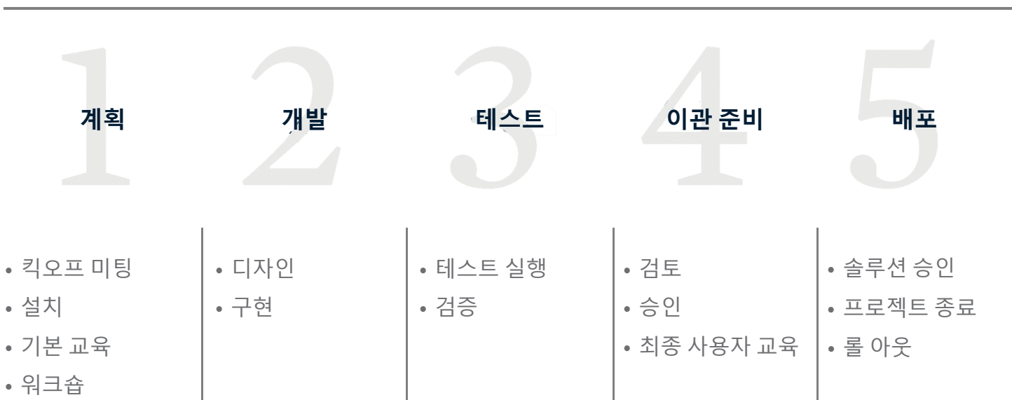
그림 6: 전문 서비스 프로세스 - 개요

우리의 성공은 여러분이 성공하는 것입니다. 우리는 모든 고객과 장기적인 관계를 구축하고자 노력하며, 고객 만족 및 고품질 결과물을 제공하는 데에 역량을 집중하고 있습니다. 우리는 우리가 하는 일에 열정을 가지고 있으며, 여러분이 어떤 환경에 있든 여러분의 실험실 작업을 신뢰합니다.