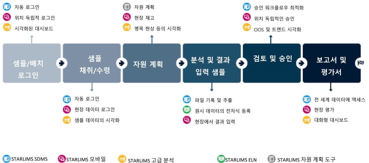
그림 2 - 워크플로우에 따른 STARLIMS 의 지원

고객의 테스트 요청을 관리합니다. STARLIMS QM 솔루션은 협업에 유용하며 결과 및 분석 인증서 (CoA)와 같은 정보를 교환할 수 있는 단일 창구를 제공합니다. 고객은 요청 관리 포털을 통해 테스트 요청을 생성하여 계약한 실험실(내부 STARLIMS 사용자)에 직접 제출할 수 있습니다. 즉, 포털에서 재료 테스트 제출, 승인, 거부, 추가 정보 요청 작업을 할 수 있습니다. 당사의 요청 관리 포털에서는 고객이 요청한 내용의 진행 상황을 언제든지 확인할 수 있습니다.