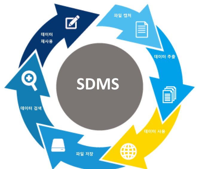
그림 3 - SDMS 개요

데이터 및 문서 승인, 유지 및 보관에 관한 사내 규칙과 관행을 준수하도록 시스템을 개인화하여 부가 가치를 형성하고 복잡성을 줄여 오류 및 지연 문제를 처리할 수 있습니다.